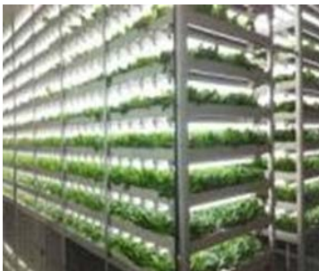
トレイ式栽培システム例