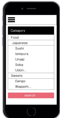
カテゴリーから検索