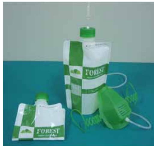
酸素発生器新商品