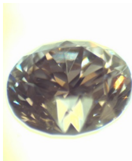
作製する宝石例(0.2カラット)