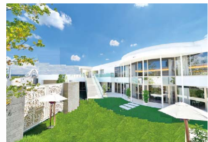
「思い出Labo」のイメージ