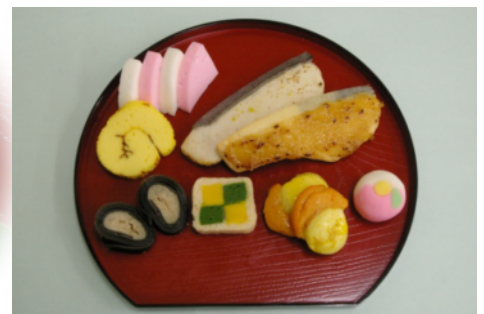
再成形ソフト食応用(おせち)