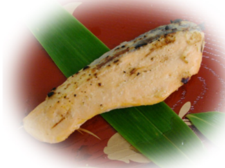
再成形ソフト食例