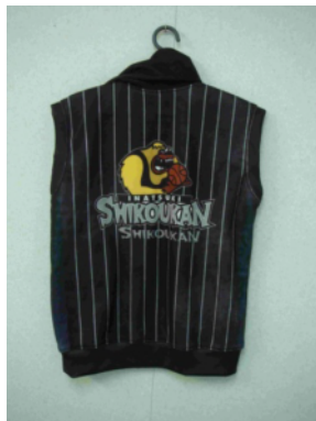
フリースへの昇華転写商品