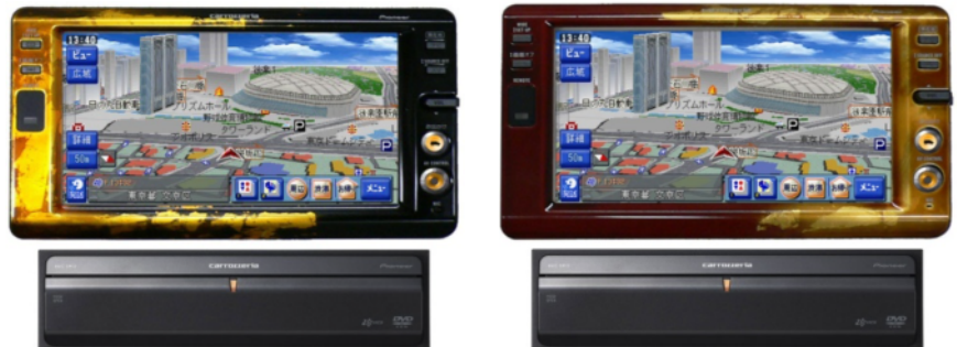
カーナビゲーションプラスチック外装部品