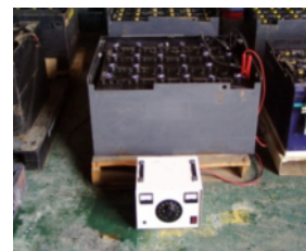
< 基礎充電・二次充電 >