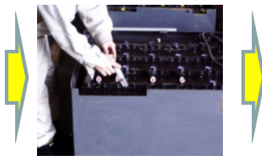
< 賦活形成剤投入 >