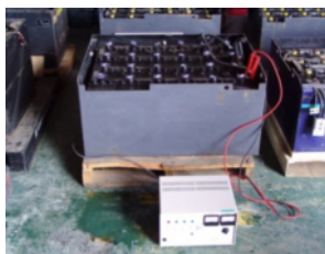
< パルス再生 >