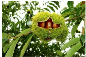
赤倉栗園で栽培される高品質で希少な西明寺栗

(株)ゆう幸が、主力商品改良のため、西明寺栗を使用した商品を開発したいと知人等を通じ生産者を探していたところ、赤倉栗園と出会うこととなった。その後、双方の保有する経営資源に魅力を感じた両者は、互いの抱える課題解決を図るパートナーとして提携し、本事業においても連携することとなった。