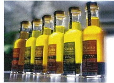
香味オイル【製品イメージ】

本事業では、ヘルシーで香りの高い小坂町産なたね油「菜々の油」のみを使用し、地元秋田県産の山菜、ハーブ等の有する効能を付加しながら、生産から最終製品加工まで地域内で一貫生産しトレーサビリティの確立した、健康志向対応の香味オイル、ドレッシングを開発する。