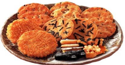
プレミアム米菓のイメージ

事業は、安心・安全、美味しさ、健康をキーワードとして、地域内連携による栽培・加工・販売までの一貫したビジネスモデルとして取り組む。