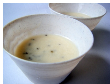
餡ペーストとエゴマを使った和風プリン(試作)