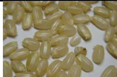
発芽玄米(めばえもち)

原料米の完全なトレーサビリティを実現した上で、本格的に一品二役の超甘口料理酒の開発・販売を行うため、今回の連携に至る。