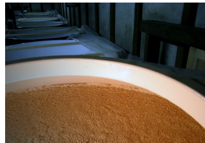
料理酒の醸造(写真はもろみ)

(有)白河園芸総合センターが生産する希少米「オオチカラ」及び「めばえもち」の2品種の発芽玄米(通常米よりGABA含むアミノ酸含有量2.5倍)を使い、(名)大木代吉本店の醸造技術により、人工添加物を用いずに旨味と甘味成分を十分含有する、一品二役の超甘口料理酒を開発・販売すると共に、料理酒分野でのブランドの確立を目指す。