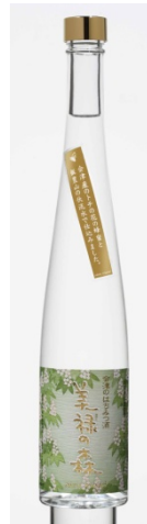
試作ミード酒「美祿の森」

(有)ハニー松本が生産する会津エリア・飯豊山系標高600-800mに自然樹生する栂の木から集める「濃度の高い朝紋り蜂蜜」を使い、(有)峰の雪酒造場が持つ独自の製造技術(醸造、ろ過、風味制御技術)によりミード酒を製造、販売することで、欧米でポピュラーなミード酒に対する「日本のミードブランド Aizu Mead」の確立を目指す。