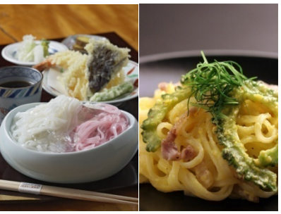
こまち麵イメージ

◆新商品又は新役務の内容とその市場性・競争力 当社の米麵は、ほかの麵には無い蒸気で米粉を練り上げる“蒸練”製法を使い、餅のようなコシの強さと、半生麵でありながらも常温・180日間という長い日持ちを実現している。今回さらに、契約農家との連携でトレーサビリティのしっかりとした、あきたこまちを確保。安全、安心、おいしい米の麵を提供し、麵市場における評価を確立していく。