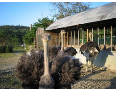
ダチョウの飼育状況

◆連携の経緯 まがら洋菓子研究所(有)は、地元の異業種グループの活動の中で、ダチョウ卵の持つ優れた起泡性を活かしてシフォンケーキ作りを試験的に行った。その結果、非常に食感の良いケーキができあがり、試験販売してみたところ、消費者からの評価が高く、当事業に本格的に取り組もうと両社の連携に至った。