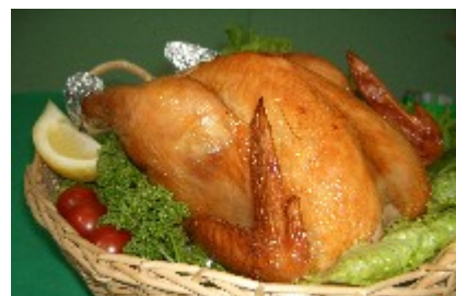
シャモ丸焼き【イメージ】

飼育～販売まで一元管理された川俣シャモを、地元産飼料米・飼料原料の研究により肉質の改良を行うとともに、地元産の厳選された醤油・塩・野菜等を組み合わせた加工品専用の無添加のタレを開発し、新しい食味で安全・安心が確立された「川俣シャモの焼き加工品」を開発・販売する。また、ブランドイメージの向上を図り、販路拡大に取り組む。