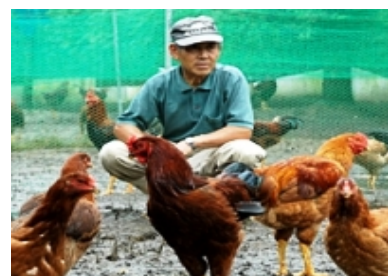
シャモの飼育状況

消費者に対する食の安心・安全が強く求められる中で、地鶏の希少性価値だけにとらわれず、採卵から加工品出荷まで一貫して管理することが両事業者間で可能であると考え、加工業者、飼育農家一体となり川俣シャモの特徴を活かした商品開発を行うこととなった。