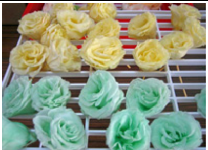
プリザーブドフラワーの生産

◆連携の経緯 (有)フラワートは、花材として薔薇が中心であったプリザーブドフラワーの加工技術を向上させ、平成18年には比較的花弁の軟らかい花であっても量産加工を可能とした。 (有)あぐり大内は、平成18年に建設業から農業進出し、健康野菜を栽培していた。今回、高級品、新製品用のプリザーブドフラワー向け花材の生産のため、農事組合法人羽後フラワーファーム(4名の農家が平成21年に設立)と共に寒冷地栽培に取り組み、連携して事業を実施するに至る。