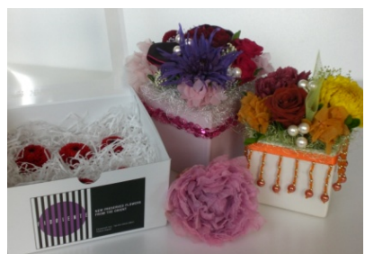
プリザーブドフラワーの製品

◆新商品又は新役務の内容とその市場性・競争力 本事業では、これまで花が厚く、形が崩れにくい花種が中心であったプリザーブドフラワー市場に対して、秋田産花材により、新しい花種で完成度の高いプリザーブドフラワーをフラワーアレンジメントやインテリアフラワー市場をメインターゲットとして販売する。 また、ヨーロッパ向けの花材生産と加工により、海外展開を図る。