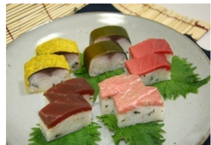
冷凍押し寿司イメージ

八戸前浜産さばを中心に、地元の鮭、鯖等特産品を原料とし、冷凍に適した低アミロース米「ゆきのはな」の適度なねばり、つや、冷めても軟らかくぼろぼろになりにくいといった特徴を活かした解凍により出来立ての食感を味わえる「冷凍押し寿司」の開発、製造、販売を行う。従来は寿司を扱い難かった飲食店等や機内食、船舶食などのニーズが高く、国内はもとより海外への市場も拡大していくものと期待される。