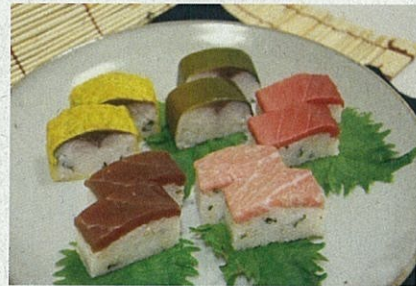
冷凍押し寿司イメージ