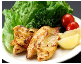
写真2 商品イメージ