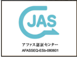
生産情報公表JASマーク