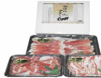
[ 今帰仁アグーの商品イメージ ]

◆ 新商品又は新役務の内容とその市場性・競争力 伐採木を資源化した木くずを利用した粉炭入りおが粉を敷材として利用し、ブランド豚として定着している沖縄在来豚今帰仁アグーの肥育環境を清潔に維持することで従来の今帰仁アグーより旨み成分の多い純系島豚の生産を図り精肉や加工品の製造販売を行う。 また、今帰仁アグーは現在、県内外高級飲食店、ホテル等への販売を行っているが需要に供給が追いつかない状況であることから枝肉の販路については確立されており、ハムなどの加工製品の開発も望まれている。