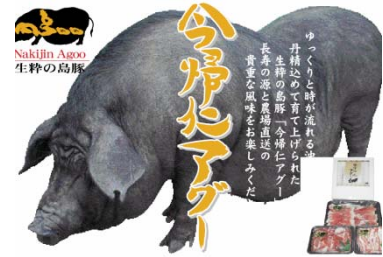
[ 今帰仁アグー ]

◆ 連携の経緯 連携体の3社は、かねてから沖縄県北部地域において、バイオマスタウン事業の導入を目指した協力体制のもと信頼関係を構築してきた。未利用バイオマスを3社で連携し循環させ「今帰仁アグー」のブランド化を図る取組において、一貫したトレーサビリティシステム確立には、合同事務所による3社の事務管理体制一本化が望ましいと考えた。その環境下で生産された原料を用いた商品は消費者の安心・安全・信頼を得ることができ、確実に販路を拡大できるという3者の思いが一致し今回の連携に至った。