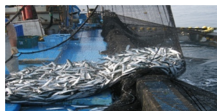
[ みじゅん(イワシの仲間)漁 ]

(株)かぎぜん寿味屋は、今後の事業推進の方向性を模索していたところ昨年より地元読谷村漁協と意見交換を行いながら「読谷漁港採れ立て新鮮」をコンセプトとした競争力のある商品開発の可能性を検討してきた。読谷村漁協は定置網漁を主とし年間を通して安定した漁獲高を誇っておりその安定した原材料供給力を生かし新商品開発を行うことを目的とし連携に至っている。