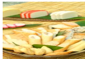
[ 新商品のかまぼこ ]

読谷村漁協の豊富な水産資源をミンチ加工し、(株)かぎぜん寿味屋へ供給することで全国でも少ない地域に根ざした「産地特定型蒲鉾」を開発・製造し、「読谷かまぼこ」のブランド化を推進していく。さらに(株)かぎぜん寿味屋の持つ販売ネットワークを駆使し、全国に市場を拡大する。