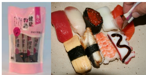
[もずくを活用した調味料]

もずくの機能性・効果を活かしつつこれをペースト状に展開することで配膳しやすく揚げ物等にも染み込まず、健康にも良いとろみのある新感覚の醤油ベースの調味料を開発する。また、技術的に様々な調味料への応用が可能なることから、全国各地の名産品関連(納豆、団子など)の調味料への製造技術提供を模索し、全国展開を目指したい。