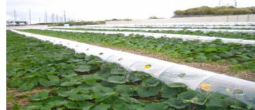
[県産野菜の栽培風景]

現在、市場に供給される野菜チップスの多くは、海外産となっており国内産比率は、まだ低い。そこで新商品の「やさい畑」は、沖縄産野菜を使用し沖縄ブランドの強みをいかし、安心と安全を提供できる商品として販路を拡大していく。