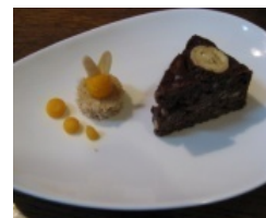
[新商品のスイーツ]