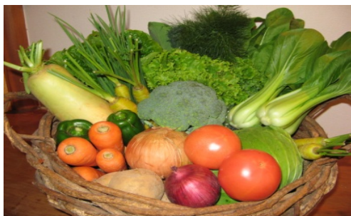
[みるく村の無農薬野菜]

特に販売については、(有)ノアが有する顧客リストを有効活用し、販路を拡大を目指す。また、インターネットを中心とした通信販売体制を構築し、既存顧客の客単価アップ、新規顧客の開拓をねらっていく。