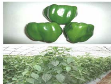
[八重瀬町産ピーマン 及びピーマン畑]

沖縄本島南部のミネラル土壌で栽培される糸満市喜屋武産にんじんと八重瀬産ピーマンは、味・栄養価とも高く評価され、県内外に青果として出荷されている。本事業では、商品開発・製造ノウハウ、販路を有するみどり食品が「産地がわかる野菜」を使用し、素材そのものが持つ味・栄養面の強みを活かした新たな惣菜(チャンプルーシリーズ等)や加工食品(漬物、スープ、菓子、茶等)を開発し、県内外の量販店、ファーマーズマーケット、飲食店や学校給食などの販路を開拓する。