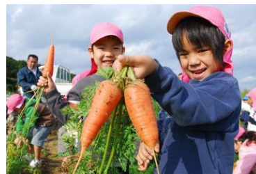
[糸満市喜屋武産にんじん]

沖縄県内量販店や飲食市場向けに惣菜、加工食品の製造販売を行っている(有)みどり食品は、産地限定野菜を活用した付加価値の高い商品開発に取り組む機会をうかがっていたところ、規格外の野菜の活用を模索していた地元八重瀬町及び糸満市の農業者と連携し、本事業に取り組むこととなった。