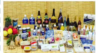
久米島の特産品群

久米島商工会では平成21～22年度と農商工連携人材育成セミナーを実施し、地元の開発意欲刺激に努めたが、そのセミナーの参加者を主体に機運が盛り上がり、セミナーだけで終わらせるのではなく、事業に主体的に取り組むべく議論を始め、平成22年10月から平成23年7月まで15回以上の会議を重ね、連携体構築、事業計画の作成を行なうことができた。当事業では沖縄県内では珍しい「地域問屋」である(株)久米島物産公社をコア企業に農産・畜産・水産を網羅した1次産業群に加工を担う2次産業も含め、久米島を挙げた取組みとなっている。