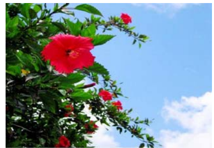
[ 沖縄在来種ハイビスカス(アカバナー) ]

(株)沖縄バヤリースは、地元の素材を活用した新たな商品開発を模索する中で、未開発の地域資源ハイビスカスへ着目していた。そこで、同じ南城市に所在しハイビスカスの栽培及び加工について豊富な経験・ノウハウを有し、ハイビスカスへの思い入れの強い農事組合法人沖縄長寿薬草生産組合と連携することとなった。また、ハイビスカスが南城市の市花であることなどから、連携することで地域産業興しの一環になればと考えている。