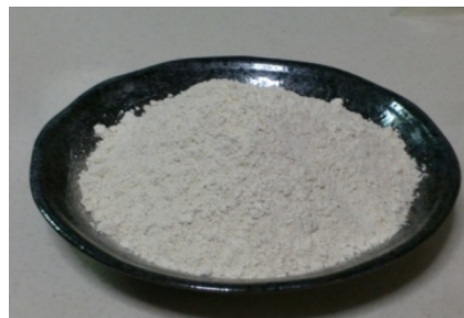
[粉末サトウキビ食物繊維]

サトウキビ生産や砂糖消費が低迷する中、(株)バガスは、製糖原料用に特化しているサトウキビの新たな製品の多様化と食の安心・安全の確保に取り組んできた。生産者と一体となり、環境等への影響を最小限に抑えた生産方式を確立し、より付加価値の高いサトウキビの安定生産及び経営改善を目標に掲げ本事業を実施するに至った。