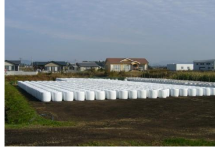
「コーンサイレージのロール」

これらの取組は飼料自給率の向上や飼料の安定的確保につながるため、国の掲げる国産飼料増産の施策とも合致するものであり、今後とも、市場ニーズの拡大が期待される。