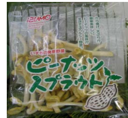
既存商品 ピーナッツもやし

原料豆自給率≒0%のもやし市場にあって、「国産小粒大豆のもやし」は、国内産の種子を使った数少ないもやしであり、緑豆もやしやマップもやしと違いタンパク質が主成分で豊富なアミノ酸を含むこと、従来のえぐみがある大豆もやしに比べ食味が良く食べ易いことに加え、通信販売等に強い(有)ベネフィットの商品企画力によって加工用途を拡大できる。