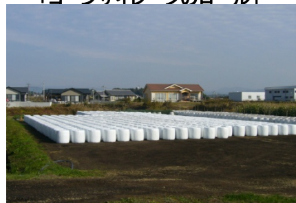
「コーンサイレージのロール」

これらの取組は飼料自給率の向上や飼料の安定的確保につながるため、国の掲げる国産飼料増産の施策とも合致するものであり、今後とも、市場ニーズの拡大が期待される。