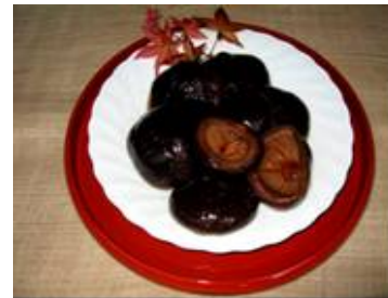
やわらかどんこ椎茸のふくめ煮

安価な商品が大勢を占める「乾しいたけ加工品」市場で本物志向の消費者需要開拓を図る。