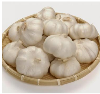
高島産高品質にんにく (ホホワイト福地六片にんにく)

本事業で開発する「燻製黒にんにく」は、一般的に販売されている熟成させた黒にんにくを更に燻製することで香ばしさを加味した商品で、商品化は当社が初めてである。また、一般的な燻製調味料は調味料自体を燻製にするが、当社の「燻製にんにく醤油」は燻製したにんにくを醤油に漬け込むことで濃厚な味としている。さらに漬け込んだにんにくをスライスし再度濃口醤油に漬け込んだ調味料「食べる燻製にんにく醤油」は新規性の高い商品で、同様に漬け込んだ燻製にんにくをチップし、そのまま食べられる「燻製にんにくチップ」も当社の独自商品である。