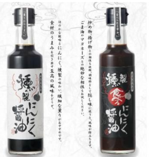
燻製にんにく醤油 食べる燻製にんにく醤油