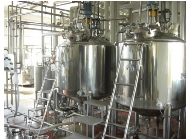
上:ヨーグルト熟成タンク 右:商品イメージ(案) 150ml,500ml

ヨーグルト市場は大手ブランドが大きなシェアを占めており、また価格競争の激しい市場である。そんな中、いかに価格に左右されずに独自ブランドを構築できるかが鍵になる。販路についても、生協への定期購入へのリストアップやインターネットを活用した独自の販売戦略の構築が最重要課題である。また、味に関しても甘酒の特徴を引き出しつつ、安心・安全に配慮した製品設計、開発を行う予定である。