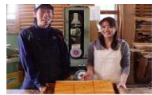
ブライダル手作りサービス

(有)木工房蔵は、木目を生かした三連時計を開発し、結婚式・披露宴での両親へのプレゼントとして人気商品になっている。この商品を販売する中で、結婚式・披露宴にかかわる商品を手作りしたいという要望が多く寄せられたため、木製の新たなブライダルギフトの開発・提供と多店舗展開を検討していた。一方、武生森林組合は、越前スギをはじめとする良質な木材を有しているものの、木材需要や森林整備をとりまく環境が変化する中で、間伐材の販路開拓が急務であった。(有)木工房蔵が必要とする木材は間伐材で対応できることから、両者の思いが一致し、連携して本事業に取り組むこととなった。