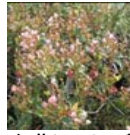
紅花シャリンバイ (ピンク)