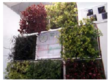
“カラフルeco5レンジャー”