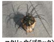
コクリュウ(ブラック)