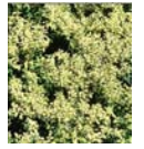
ゴールデンジェム (イエロー)