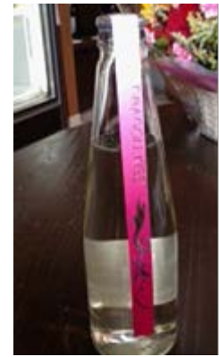
発泡性清酒 試作品 ドラゴンキッス

おいしいお酒を造るためには米の品質が大切であるが、醸造好適米である山田錦は、地方の小さな酒蔵としては、なかなか手に入らないのが実情である。その対策として、稲の栽培方法について共通の価値観を有している九頭竜オーガニックファームと連携して、米作りからこだわった酒造りを行うため、山田錦の契約栽培を行うことになった。これにより、トレーサビリティはもちろんのこと、田んぼごとの米の出来具合や、品質を的確に把握し、酒造りに生かすことができる。