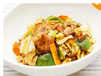
【調理イメージ(回鍋肉)】