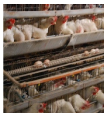
こだわりの飼育方法

本事業は、地域の固有資源を保全しながら地域経済を振興するエコ・ツーリズムに、養鶏事業を核とした利助農法(循環型農業システム)とびわ湖の水質保全をウオーター・スポーツの中で考えようという二つの体験学習を組み込んだ新しい観光サービスである。エコ・ツーリズムへの関心が内外で高まる中、世界有数の古代湖であるびわ湖とその周辺自然環境を地域全体として保全活用する当事業内容は、事前アンケートにおいても多くの期待が寄せられている。