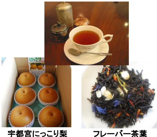
宇都宮にっこり梨

今まで水分が多く乾燥することが難しいとされた梨を、新しく開発する紅茶フレーバーのベースとするため、皮をむき、乾燥させた皮を提供する。また果肉についても乾燥させ、乾燥果実として提供する。さらに需要の開拓には「宇都宮のおもてなし紅茶」としての情報発信を行い、新たな紅茶消費者の開拓、宇都宮市へ来街した観光客をターゲットとして事業転換を図る。