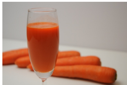
【「アロマレッド」と人参ジュース】

アロマレッドの栽培は比較的寒冷な気候が適しており、本品に適した、香りがでるアロマレッドの栽培方法を(株)大雪を囲む会が取組む。さらに1年を通して安定供給するため、北海道以外の農業者にも連携参加を促した。(株)一粒万倍はアロマレッドをフルーティで栄養価豊富なジュースにするための低速絞り技術の活用や加工方法の開発に取組む。さらに、大量に出る搾りかすを利用して付加価値の高い商品開発につなげていく。