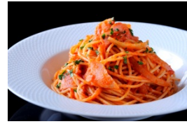
【トマトソースパスタ】