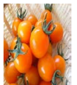
【ピッコロカナリア】