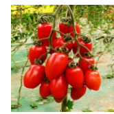
【シシリアンルージュ】

両社は地元の若手経営者として予めから親交があり、3年前に(有)丸清製麺がスープ開発のために川島農園から野菜を仕入れたことを契機に取引を開始。丸清製麺の商品展開とともに取引が拡大し、信頼関係も深化。今回、地域性豊かな付加価値の高い商品づくりへの想いが合致し、連携に至った。