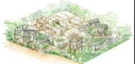
直売場(まなび野・浜名湖)

浜松は農業生産高全国第4位ともものづくりの街である一方、作物の大半は首都圏に供給されるなど、地元の消費に直結していない。また、イチゴ狩り等観光農園も需要に対して供給が間に合わない現状となっている。そこで、最新の「クラウド制御」栽培技術と、外気に影響されにくい温室構造をベースとする省エネルギー技術による栽培環境制御システムを活用した1年中イチゴ狩りが出来る観光農園を建設、また地産地消をコンセプトに浜松の農産物を取りそろえた直売所をガーデニングの世界チャンピオンの設計プロデュースによる施設により運営する。