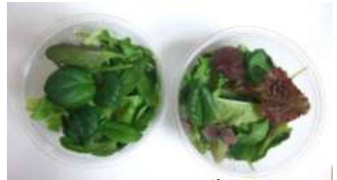
ビタミンに特化したリーフ