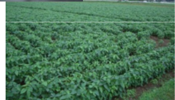
鳩山町大豆栽培組合の圃場

(有)とうふ工房わたなべにおいては、豆腐の保存食（豆腐の味噌漬け、豆腐の燻製等）と健康スイーツ（豆乳プリン、おからケーキ、豆乳アイス等）を商品化し、地産地消を推進する商品としてブランド構築を目指す。鳩山町大豆栽培組合においては、高たんばく質の大豆種の減農薬栽培に取り組み、栽培技術を確立するとともに、栽培面積を順次拡大していくことで、遊休農地の有効活用を図っていく。