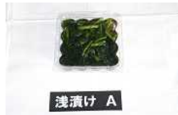
クレソン漬物試作品

食に対する安全、安心、健康志向から、県内で漬物加工に高い技術を有する(株)みしな食品では、消費者嗜好の多様化から新しい商品開発を模索していたところ、クレソンの機能性に関する成果を知るに至った。そこで、山梨県道志村で長年にわたりクレソンを栽培している大辻クレソンを山梨県中小企業団体中央会から紹介され、連携するに至った。